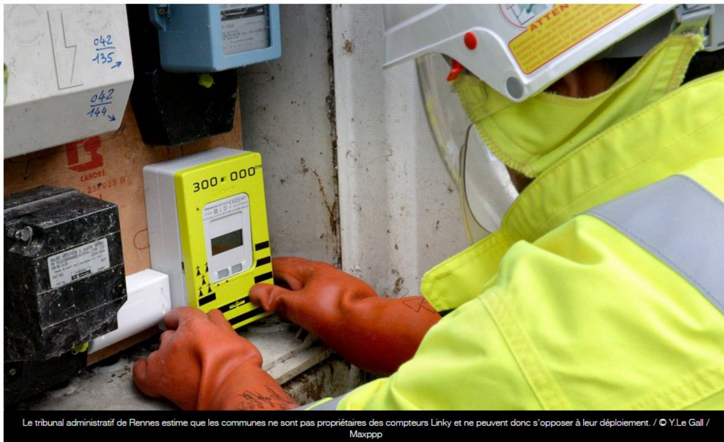
Le tribunal administratif de Rennes estime que les communes ne sont pas propriétaires des compteurs Linky et ne peuvent donc s'opposer à leur déploiement.