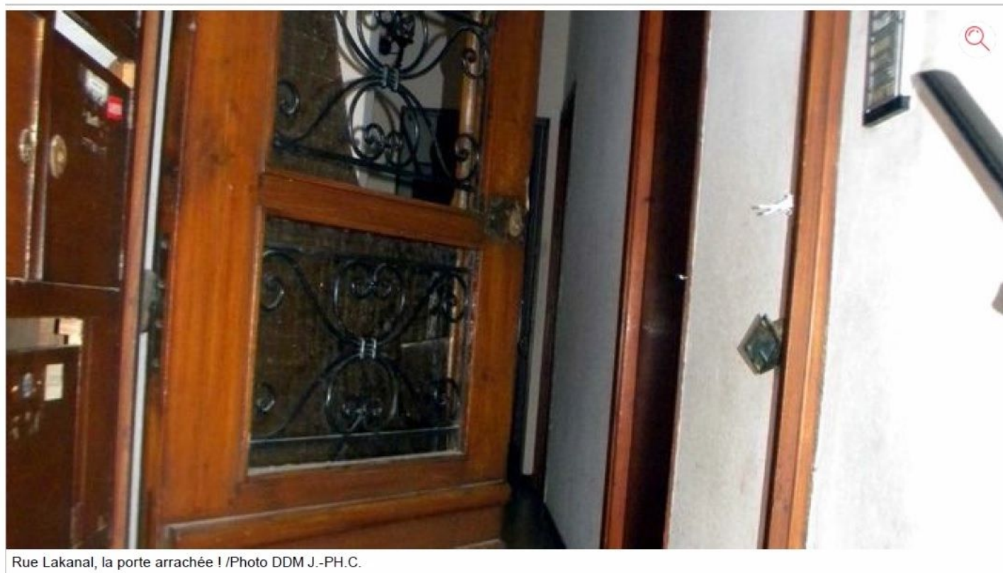
Rue Lakanal, la porte arrachée !

Deux installations de compteurs Linky en centre-ville donnent lieu à une levée de boucliers. Notamment une opération qui s'est traduite par une porte fracturée !